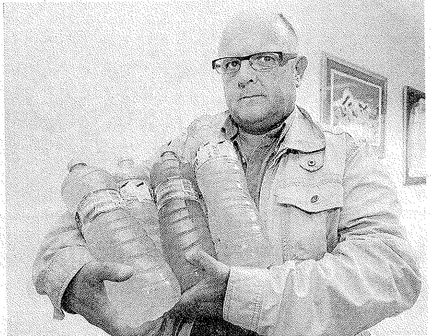
Polémica. El agua ha perdido turbidez, pero los controles de calidad son todavía insuficientes.

La denuncia dio lugar a una investigación por parte de los técnicos de la administración regional, quienes detectaron «turbidez por encima del nivel 6 UNF» y, en consecuencia, calificaron el agua como «no apto para el consumo humano». El informe de los téc-